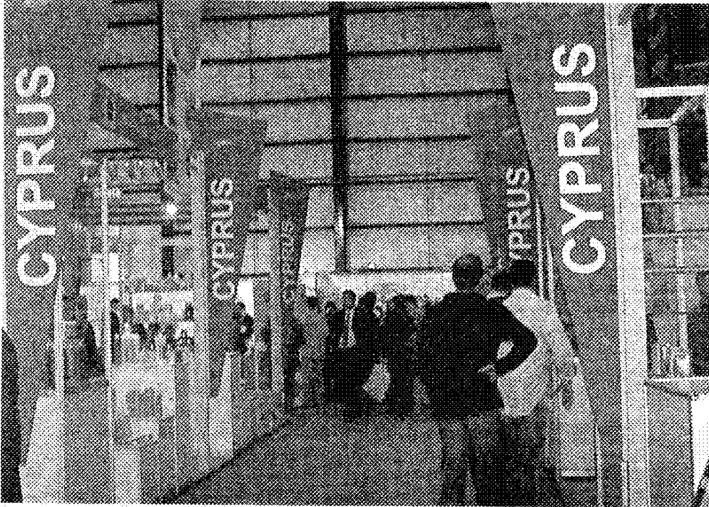
■ الجناح القبرصي في معرض "هورিকা"

استعداد ملتقى ومعرض "هورিকা" الذي انتهت أعماله في بيال، الرهجة التي فقدتها العام الماضي بسبب اغتيال الرئيس رفيق الحريري، إذ بلغ عدد العارضين هذا العام 220 بالمقارنة مع 180 خلال العام الماضي، علماً أنه وصل في العام 2004 إلى 230 عارضاً، وحظي بما يزيد عن 14 ألف زائر.