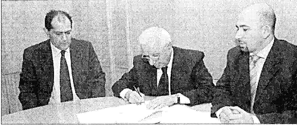
□ الزعتري يوقع الإتفاق □